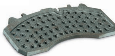
Odlewana płytka nośna