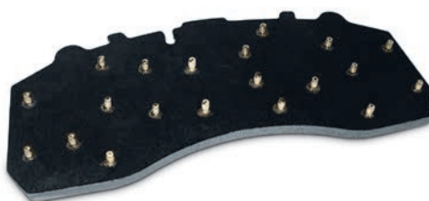
Płytki nośna z mosiężnymi kołkami