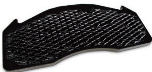
Stalowa płytka z kratką